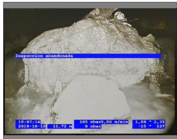
Foto: 5_8A 11,72m, Inspeccion abandonada / Ninguna, dentro de los parámetros admisibles