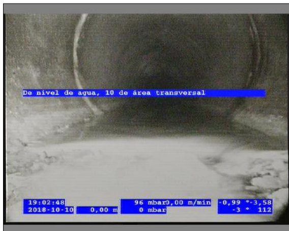
Foto: 5_3A 0m, De nivel de agua, 10 de área transversal / Ninguna, dentro de los parámetros admisibles