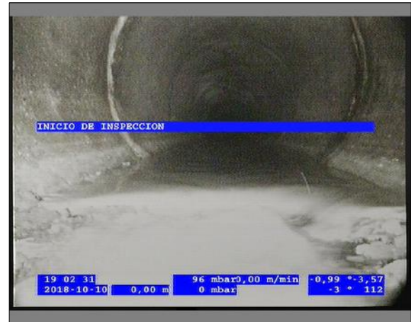
Foto: 5_2A 0m, INICIO DE INSPECCION / Ninguna, dentro de los parámetros admisibles