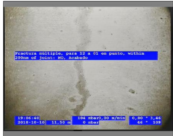
Foto: 5_6A 11,5m, Fractura múltiple, para 12 a 01 en punto, within 200mm of joint: NO, Acabado / Se recomienda realizar la reparación puntual