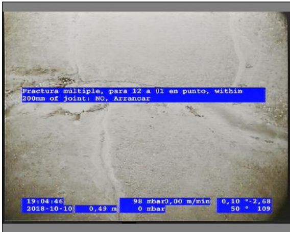
Foto: 5_5A 0,49m, Fractura múltiple, para 12 a 01 en punto, within 200mm of joint: NO, Arrancar / Se recomienda realizar la reparación puntual