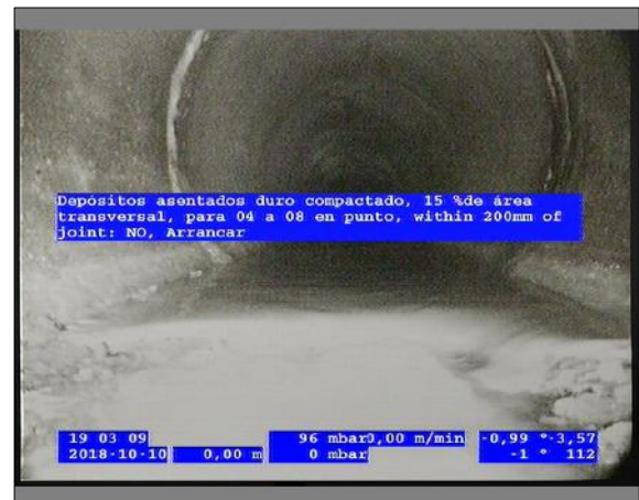
Foto: 5_4A 0m, Depósitos asentados duro compactado, 15 %de área transversal, para 04 a 08 en punto, within 200mm of joint: NO, Arrancar / Se recomienda la limpieza