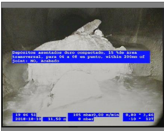
Foto: 5_7A 11,5m, Depósitos asentados duro compactado, 15 %de área transversal, para 04 a 08 en punto, within 200mm of joint: NO, Acabado / Se recomienda la limpieza