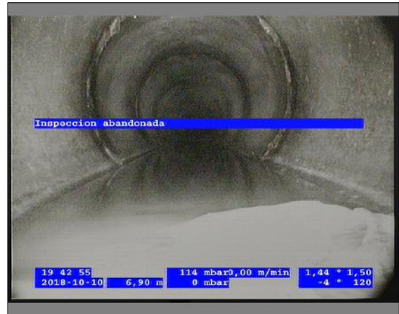
Foto: 7_6A 6,9m, Inspeccion abandonada / Ninguna, dentro de los parámetros admisibles