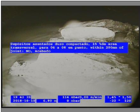
Foto: 7_5A 6,9m, Depósitos asentados duro compactado, 15 %de área transversal, para 04 a 08 en punto, within 200mm of joint: NO, Acabado / Se recomienda la limpieza