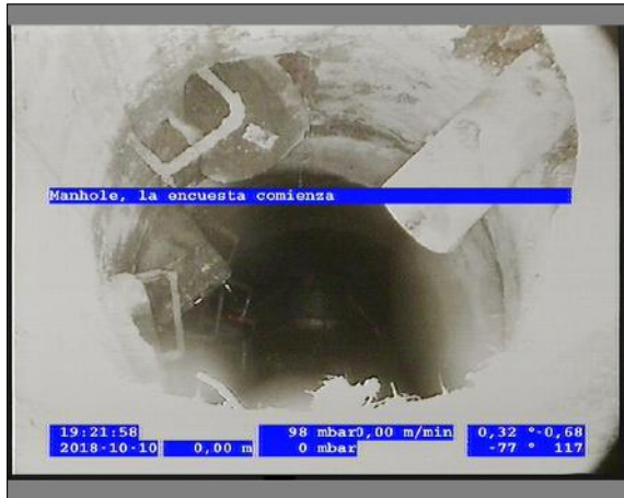
Foto: 7_1A 0m, Manhole, la encuesta comienza / Ninguna, dentro de los parámetros admisibles