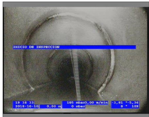
Foto: 7_3A 0,05m, INICIO DE INSPECCION / Ninguna, dentro de los parámetros admisibles