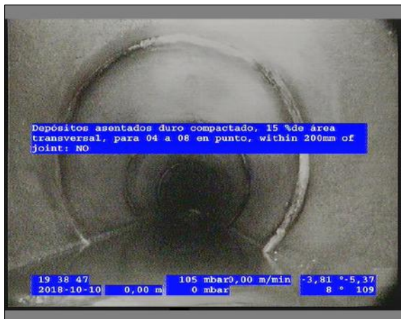
Foto: 7_3A 0m, Depósitos asentados duro compactado, 15 %de área transversal, para 04 a 08 en punto, within 200mm of joint: NO, Arrancar / Se recomienda la limpieza