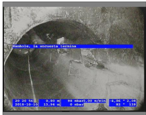
Foto: 8_4A 13,94m, Manhole, la encuesta termina / Ninguna, dentro de los parámetros admisibles