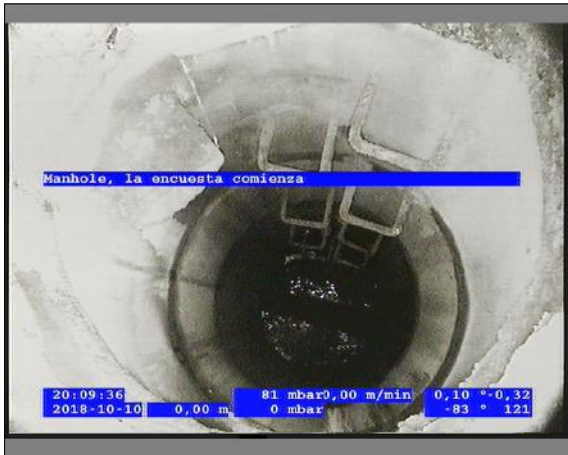
Foto: 8_1A 0m, Manhole, la encuesta comienza / Ninguna, dentro de los parámetros admisibles