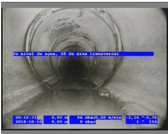
Foto: 8_3A 0m, De nivel de agua, 10 de área transversal / Ninguna, dentro de los parámetros admisibles