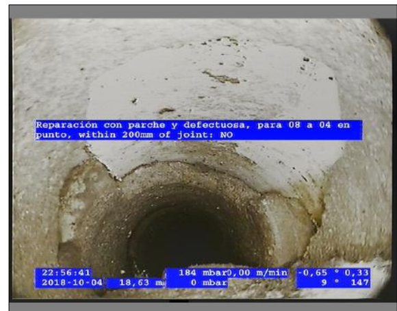
Foto: 3_8A 18,63m, Reparación con parche y defectuosa, para 08 a 04 en punto, within 200mm of joint: NO / Se recomienda realizar la reparación puntual