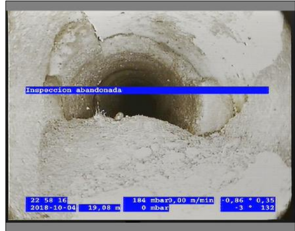
Foto: 3_10A 19,08m, Inspeccion abandonada / Ninguna, dentro de los parámetros admisibles