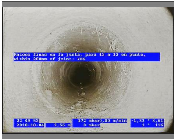
Foto: 3_5A 2,56m, Raíces finas en la junta, para 12 a 12 en punto, within 200mm of joint: YES, Arrancar / Ninguna, dentro de los parámetros admisibles