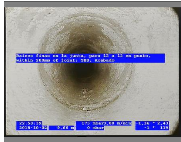
Foto: 3_6A 9,66m, Raíces finas en la junta, para 12 a 12 en punto, within 200mm of joint: YES, Acabado / Ninguna, dentro de los parámetros admisibles