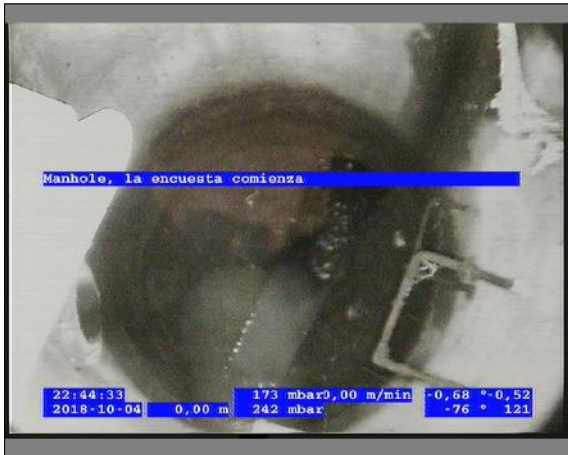
Foto: 3_1A 0m, Manhole, la encuesta comienza / Ninguna, dentro de los parámetros admisibles