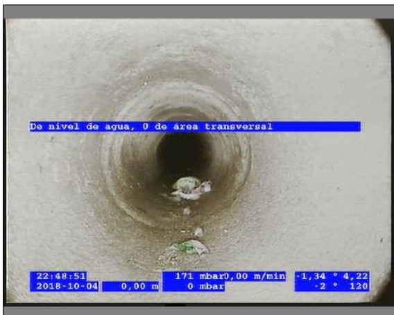
Foto: 3_3A 0m, De nivel de agua, 0 de área transversal / Ninguna, dentro de los parámetros admisibles