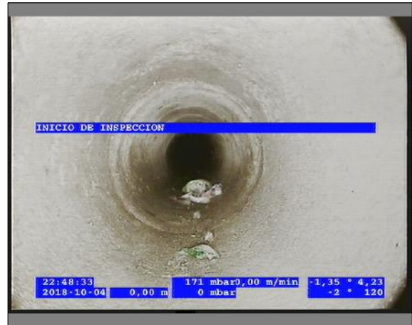
Foto: 3_2A 0m, INICIO DE INSPECCION / Ninguna, dentro de los parámetros admisibles