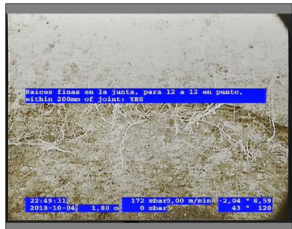
Foto: 3_4A 1,8m, Raíces finas en la junta, para 12 a 12 en punto, within 200mm of joint: YES / Ninguna, dentro de los parámetros admisibles