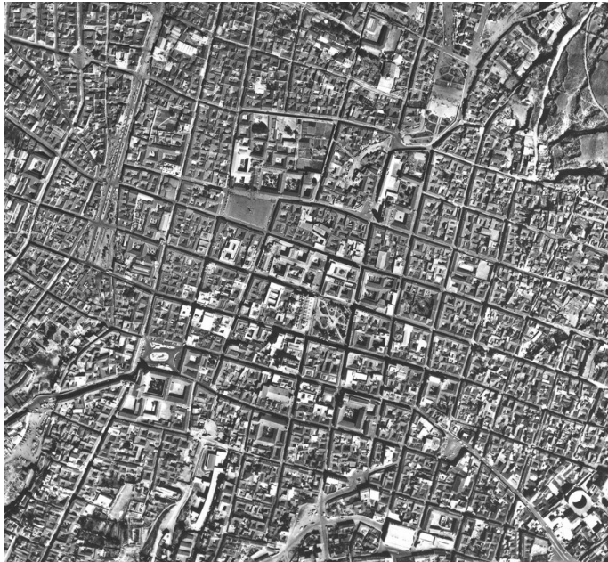
FOTOGRAFÍA AÉREA I.G.M. 1959