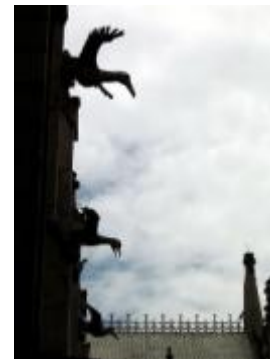
Gárgolas fauna ecuatoriana Basilica del Voto Nacional