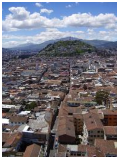
CHQ desde la espadaña de las Agustinas de la Encarnación