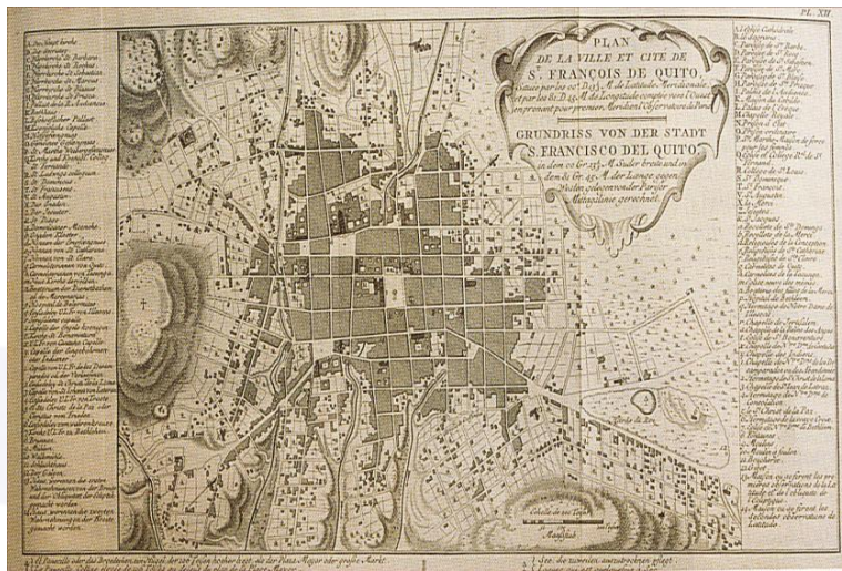
POR JORGE JUAN Y ANTONIO DE ULLOA 1740